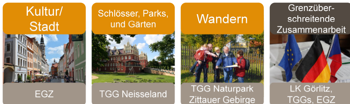
Abb. 6: Kompetenzen für die Oberlausitz