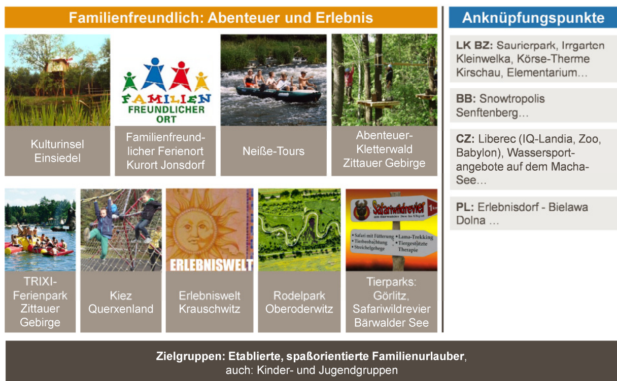
Abb. 4: Thematischer Schwerpunkt und Angebote (4)