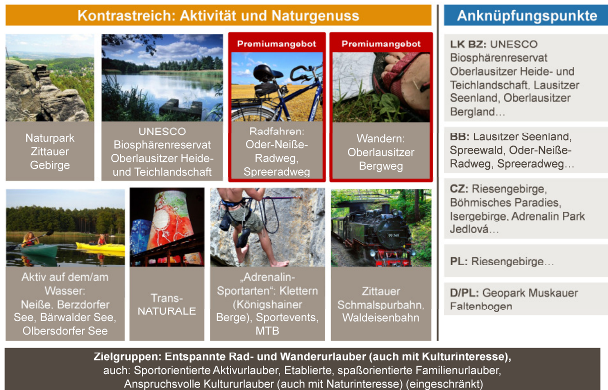
Abb. 3: Thematischer Schwerpunkt und Angebote (3)